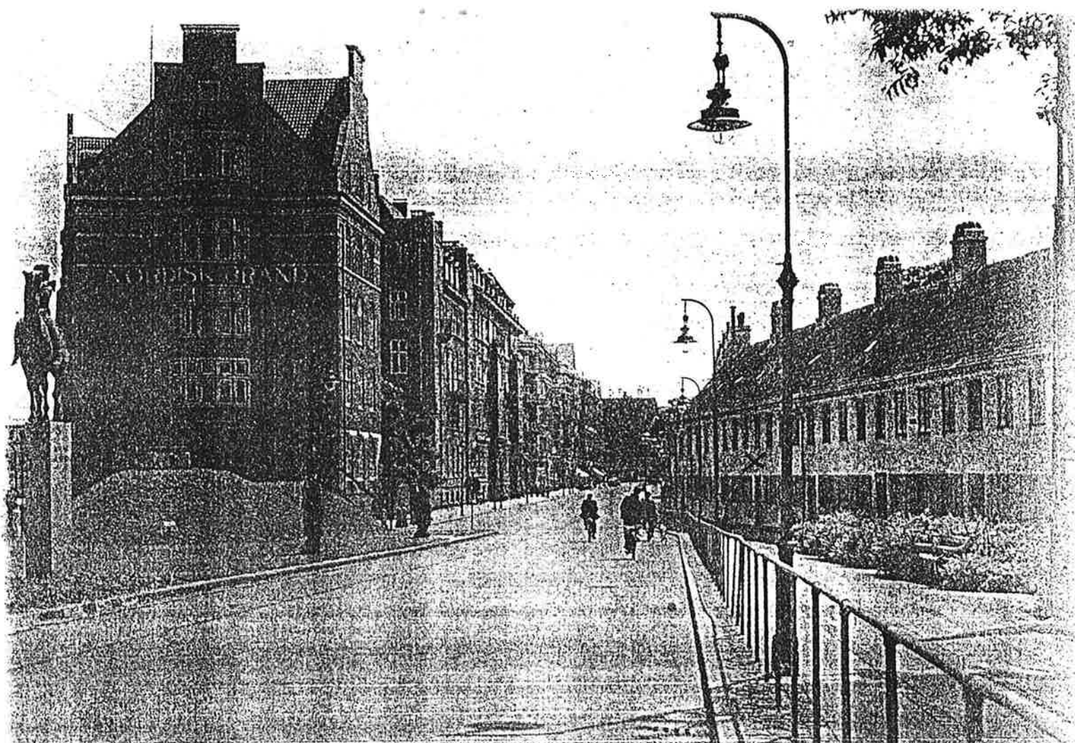
X. Store Kongensgade 141. 41.

Vej til Østerport var endnu omkring 1750 den mere eller mindre officielle Betegnelse paa Stykket af Store Kongensgade fra Toldbodvej til Østerport. Navnet Ny Østergade kom først i Brug, efter at Nyboder var udbygget til sit endelige Omfang. Underligt nok havde man en Overgang sidst i 1600erne tænkt paa helt at lukke Østerport